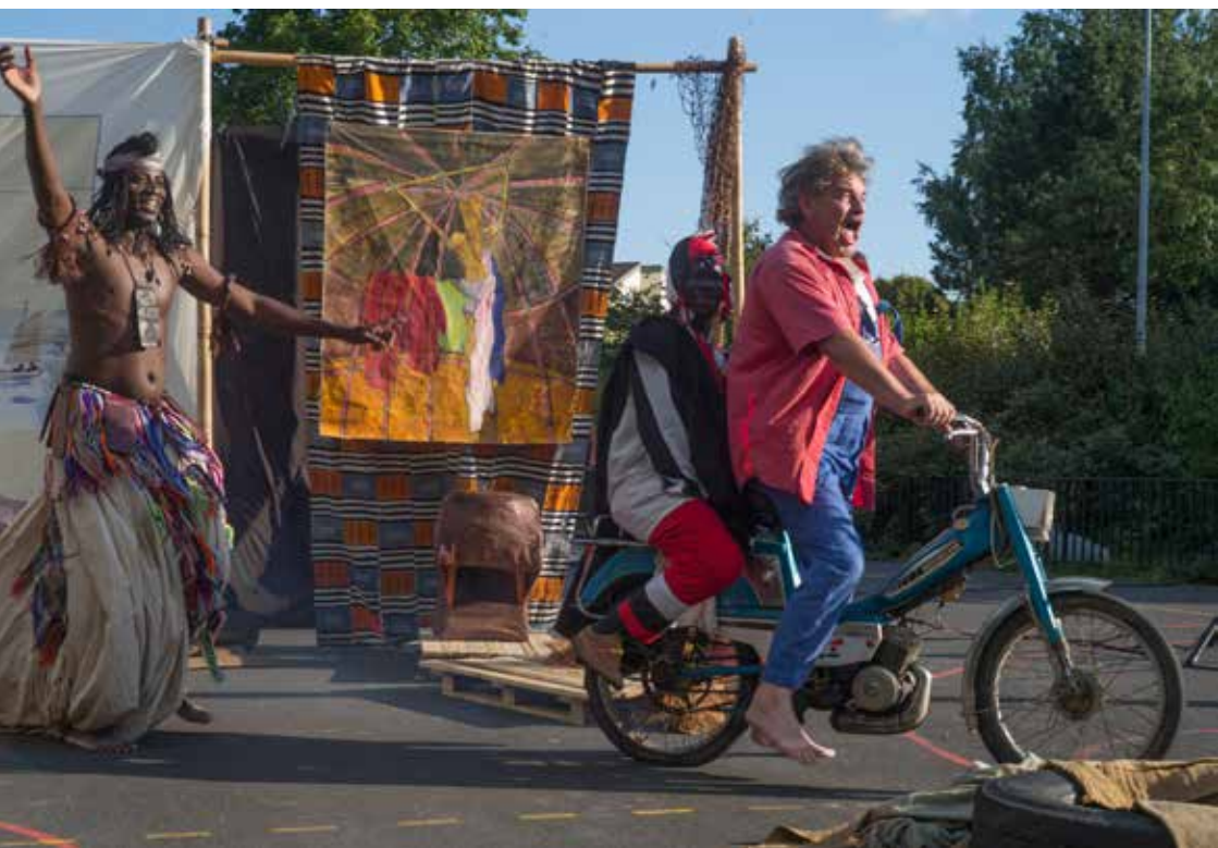
« Les tréteaux du Niger » Auteur : Jean-Pierre Estournet