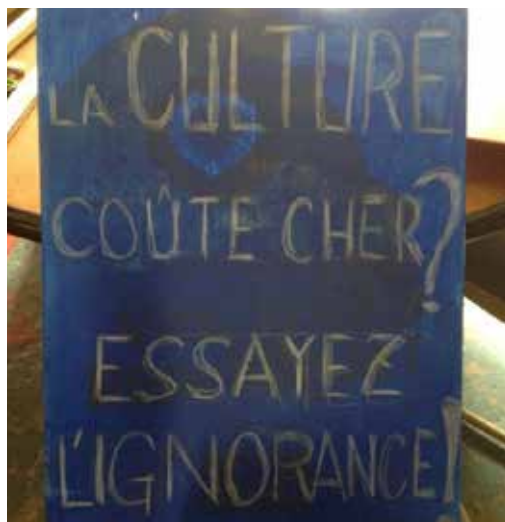
Auteure : Danièle Atala

Le marketing, maintenant intensif et ciblé sur les outils numériques, accompagne le flux de « produits culturels ». Il prétend au pluralisme et à la liberté de choix. Pourtant, il n'engendre pas l'indépendance d'esprit mais une culture de masse homogène. Il est une propagande. Cet usage de l'art permet de formater les comportements. Il facilite l'amnésie, la confusion et la passivité dans les têtes. Il valorise la consommation plutôt que la compréhension, l'accumulation et non l'expression, l'obéissance plutôt que l'insoumission. Il sert les ventes et les produits plutôt que de toucher les âmes et susciter les pensées. Utiliser la création comme ça, c'est de l'art-naque !