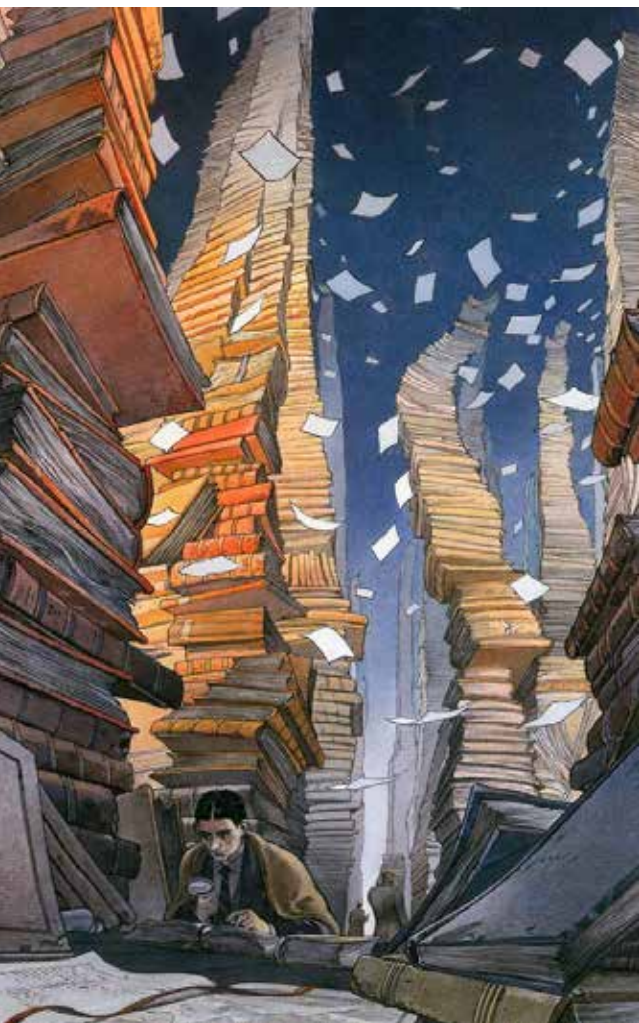
François Schuiten, album « L'archiviste »